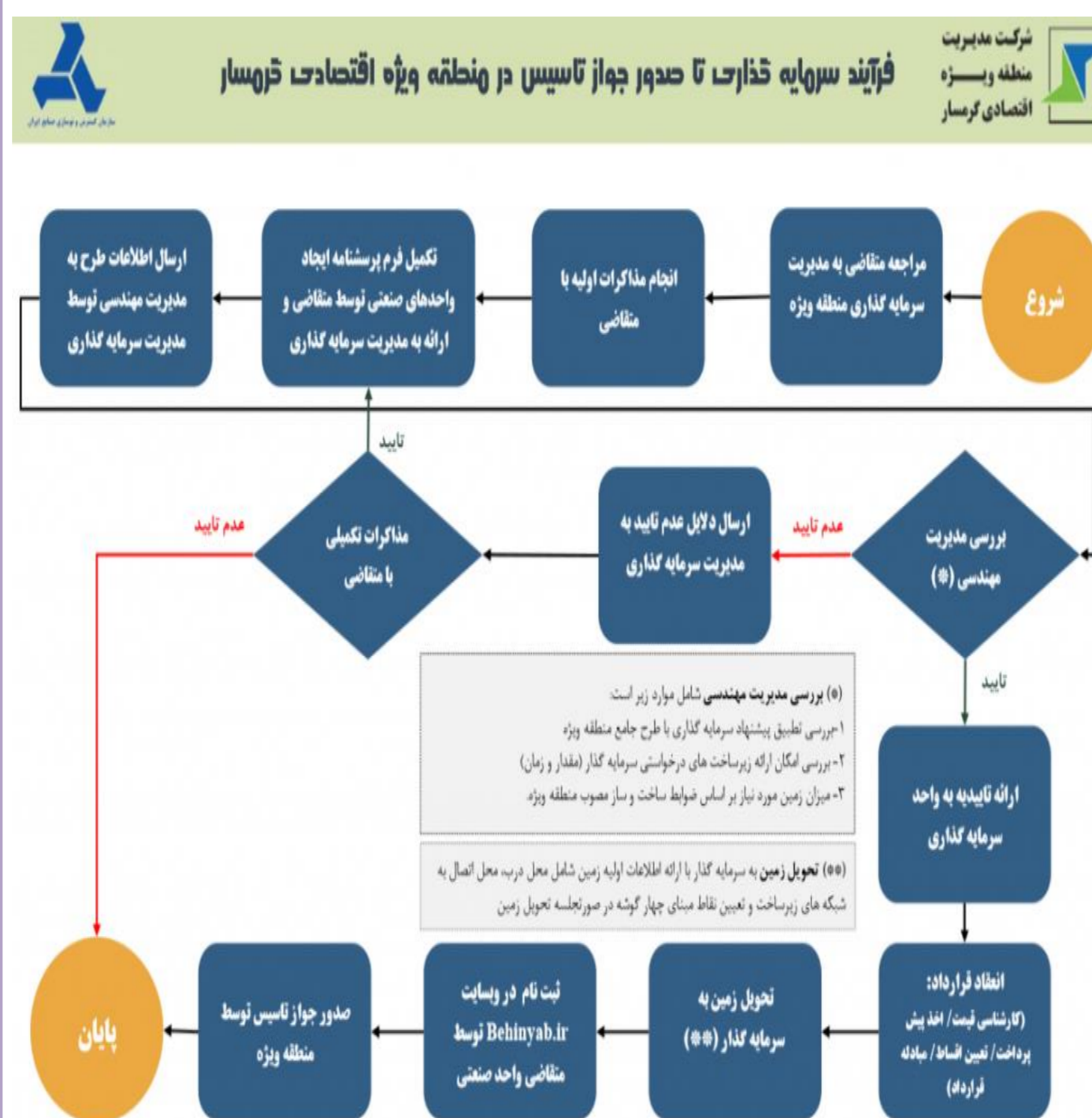
شکل ۲ دیاگرام فرآیند سرمایه گذاری