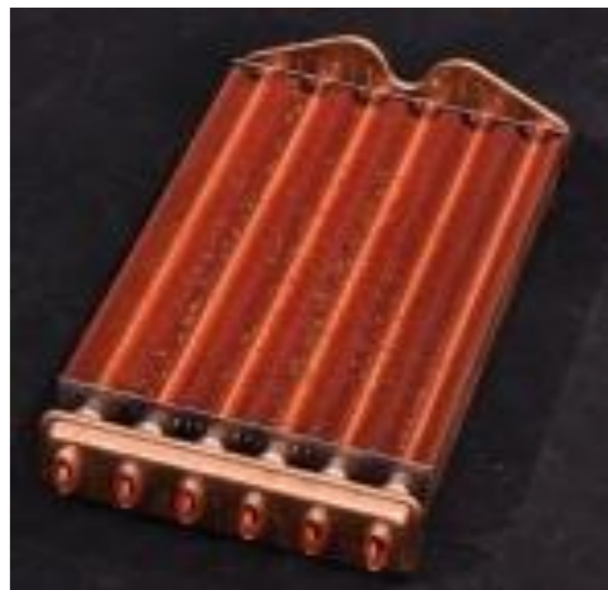
شکل 1 شمای محصول تولیدی