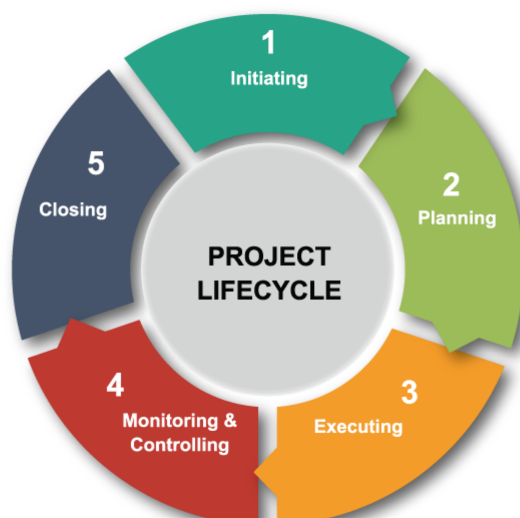
شکل ۲ چرخه عمر مدیریت پروژه در PMBOK