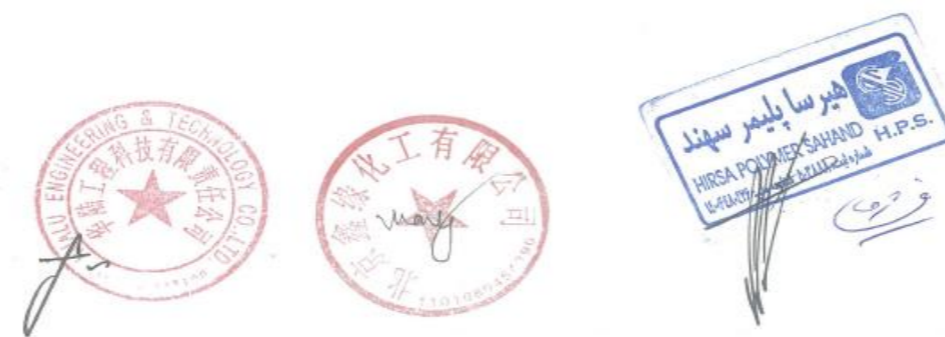
شکل ۱ سند انتقال تکنولوژی از چین به شرکت

SUPOL PP TECHNOLOGY PROPYLENE POLYMERIZATION PROCESS LIMITED LICENSE AGREEMENT (No: HLET-18B02-04A2) AMONG HIRSA POLYMER SAHAND COMPANY (LICENSEE) AND HUALU ENGINEERING & TECHNOLOGY CO., LTD. (EPCC CONTRACTOR) AND BEIJING SCIENPARK CHEMICAL ENGINEERING CO., LTD. (LICENSOR)